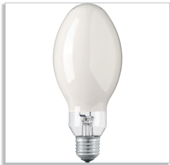
HPL 4, E27